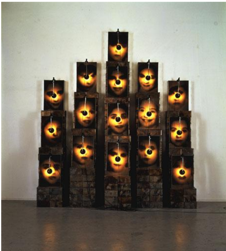
Christian Boltanski: Reliquary , 1990. Collection Toyota Municipal Museum of Art, Japan. Taiteilijan ja Marian Goodman Galleryn luvalla, Pariisi /New York.

Kiinnostuksella yksilöiden kohtaloihin suurten ihmisjoukkojen ja niitä koskevien tapahtumien rattaissa sekä kaiken sattumanvaraisuudella on juurensa Boltanskin omassa historiassa.