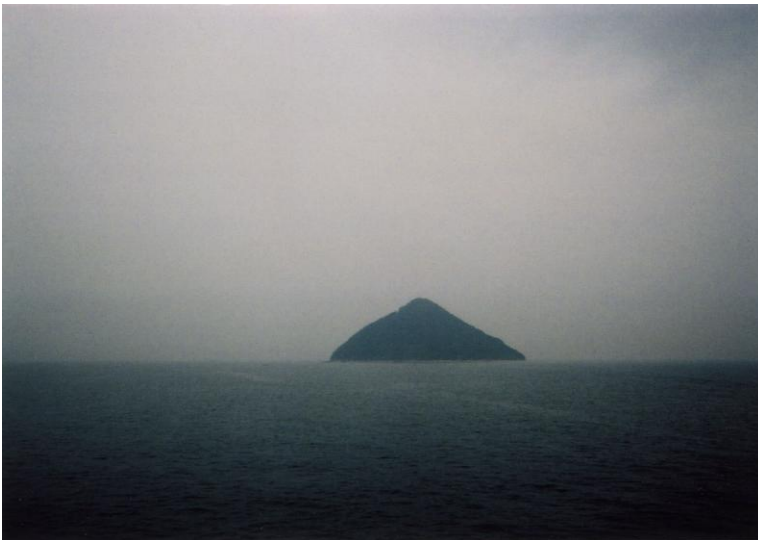
Christian Boltanski. Ejiman saari. Taiteilijan, Marian Goodman Galleryn ja Naoshima Fukutake taidemuseosäätiön luvalla.

Tässä opetusaineistossa on neljä osaa ja epilogi. Kukin osa avaa yhden Christian Boltanskin taiteeseen ja Sydänarkistoon liittyvän teeman. Lyhyiden tekstien lopussa on ehdotuksia keskustelunaiheiksi ja tehtäviksi. Osasta löytyy myös linkkejä ja ehdotuksia toisista taiteilijoista käytettäväksi vertailukohtana. Vertailuaineistoa on tarkoitus itse hakea netistä tai kirjastoista. Myös oppilaita voi ohjata etsimään tietoja ja käyttämään niitä esimerkiksi esseen aineistona. Osa tausta-aineistosta edellyttää englannin kielen taitoa ja sisältää melko käsitteellisiä pohdintoja. Opettajat ja ryhmien vetäjät voivat valikoida ja soveltaa kysymyksiä ja tehtäviä ryhmänsä ikätason ja tarpeiden mukaisiksi.