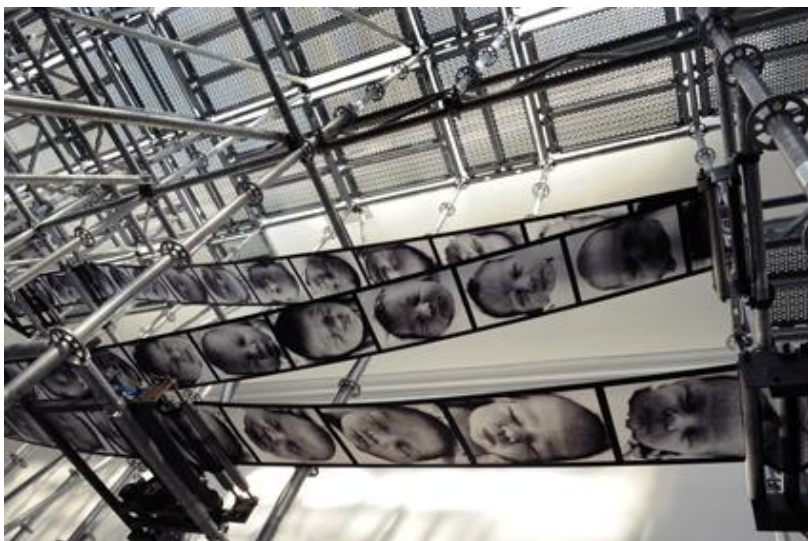
Christian Boltanski: Chance - The Wheel of Fortune , 2011, Ranskan Paviljonki, Venetsian Biennaali, 2011. Taiteilijan ja Marian Goodman Galleryn luvalla, Pariisi / New York. Kuva: Didier Plowy

Boltanski käyttää aina suurta joukkoa kuvia ihmisten kasvoista. Yksi yksittäinen kuva keskittyisi hänestä liikaa yksilöön, kuvajoukko sen sijaan on tarpeeksi abstrakti, se ei merkitse ketään erilliseksi kuin muut. Teokset ovat siten tarpeeksi avoimia, jotta katsoja täydentää ne omalla yksilöllisyydellään, tunnistaa kuvissa kaltaisensa ja tavallaan liittää oman tarinansa teoksen osaksi.