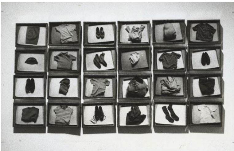
Christian Boltanski: Les Habits de François C. , 1972 24 valokuvaa.

The Contemporary Art National Collection (CNAP). Taiteilijan ja Marian Goodman Galleryn luvalla, Pariisi/New York