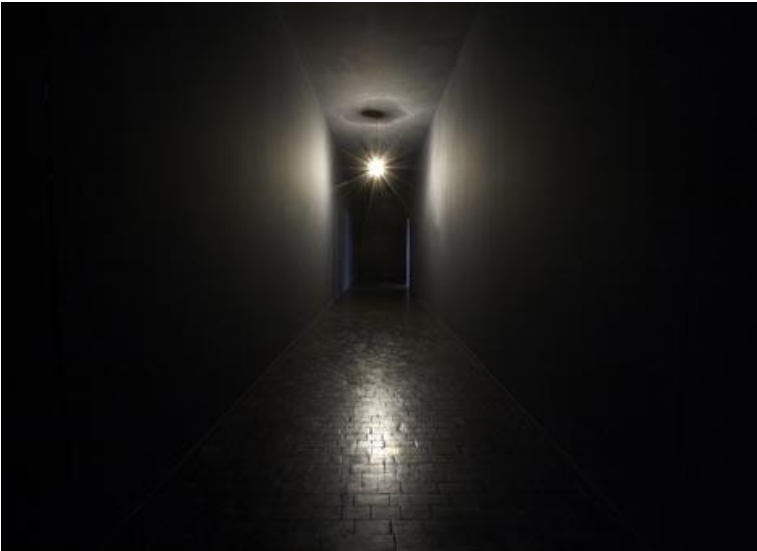
Christian Boltanski My heart, 2005. Näkymä näyttelystä Prendre la parole. Marian Goodman Gallery Paris, 2005.

Sydän, tuo omistajansa nyrkin kokoinen lihas, alkaa pumpata verta jo varhain sikiöaikana ja jatkaa sitä väsymättä aina loppuun asti. Usein tuo loppu tulee juuri silloin, kun sydän syystä tai toisesta ei enää pysty jatkamaan. Sydän on osa ihmisen ruumiillista olomuotoa, vaikka piilossa katseilta. Sen voi kuitenkin tuntea ja kuulla. Vaikka monen muunkin elimen toiminta on elintärkeää, tuntuu juuri sydämeen tiivistyvän koko ihmisen elinvoima.